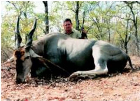
Stephan met 'n sobord