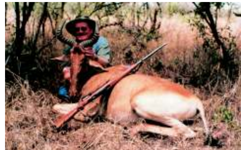
Piet Smit met 'n Cokes Hartbees